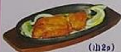
(皿2p) タンドリーチキン ¥600 土曜で焼いた香ばしいチキン