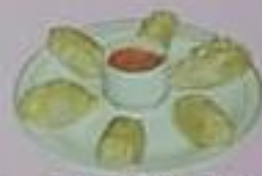
モモ (6p) ¥600 6cm x 6cm x 1cm