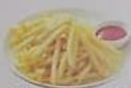
ポテトフライ ¥350 (17cm x 3cm x 1cm)