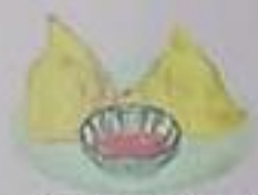
せもせ (2p) ¥400 (17cm x 3cm)