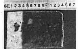
▲赤色が消えていると中性化が進んでいる

コンクリートからアルカリ性が失われると、内部の鉄筋が腐食し、コンクリートのひび割れを起こすなどの劣化が進むため、中性化深さを測定します。また、測定の結果、中性化が進んでいる場合は、鉄筋の腐食状況を直接目視で確認します。