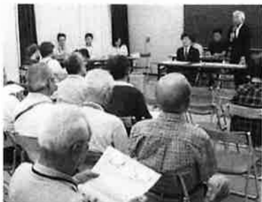
▲意見交換会の様子