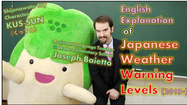
動画サムネイル (紹介画像)