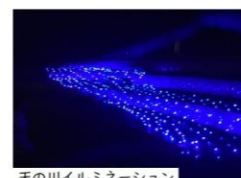
天の川イルミネーション