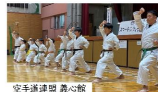
空手道連盟 義心館