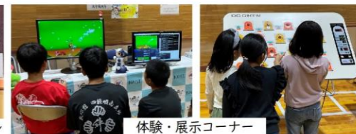
体験・展示コーナー