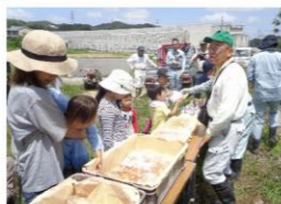
カジパン工房さんのパンを配布